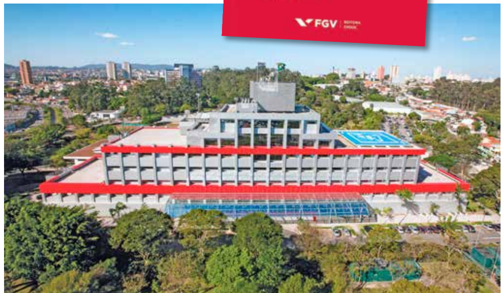
Cidade de Deus, sede do Banco em Osasco (SP)