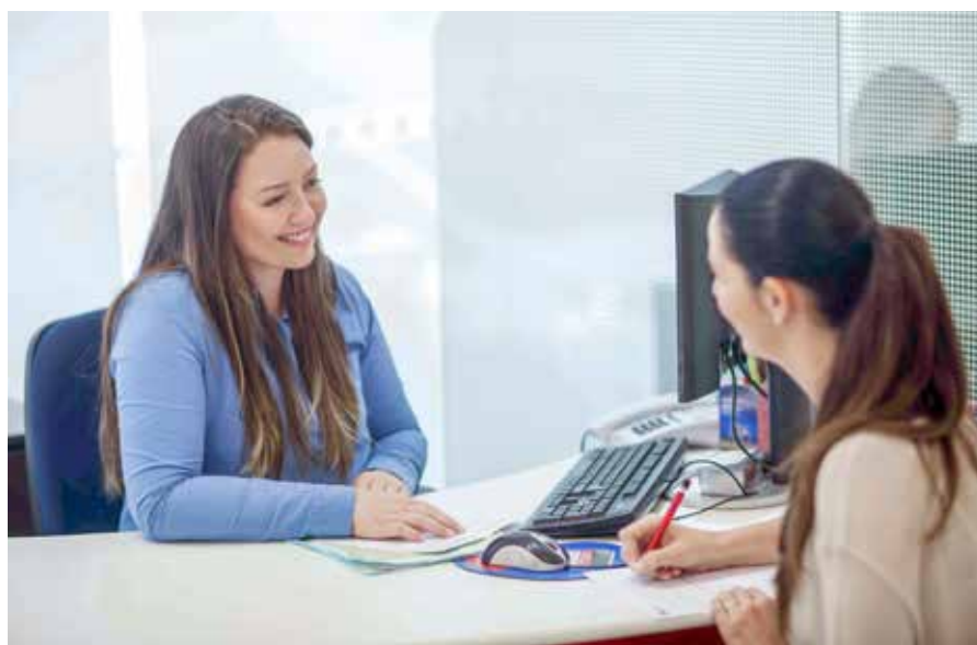
Receitas com prestação de serviços evoluíram 12,8% entre 2015 e 2016

A carteira de crédito expandida somou, em dezembro de 2016, R$ 515 bilhões, com alta de 8,6% em relação ao saldo verificado