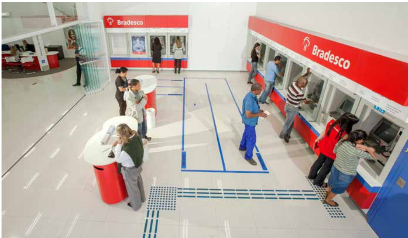
Rede de Atendimento: mais de 60 mil pontos em todo o País

Entre todas as instituições financeiras listadas na BM&F Bovespa, o Bradesco foi a que mais se valorizou em 2016. Segundo levantamento da consultoria Economática, publicado na imprensa, o Banco encerrou o ano com um valor de mercado de R$ 154 bilhões, uma evolução de R$ 54 bilhões em relação a 2015. Em janeiro deste ano, também segundo a Economática, o Bradesco liderou novamente o setor com expressiva valorização. O valor de mercado do Banco chegou a R$ 179,3 bilhões, com um acréscimo de R$ 18,5 bilhões