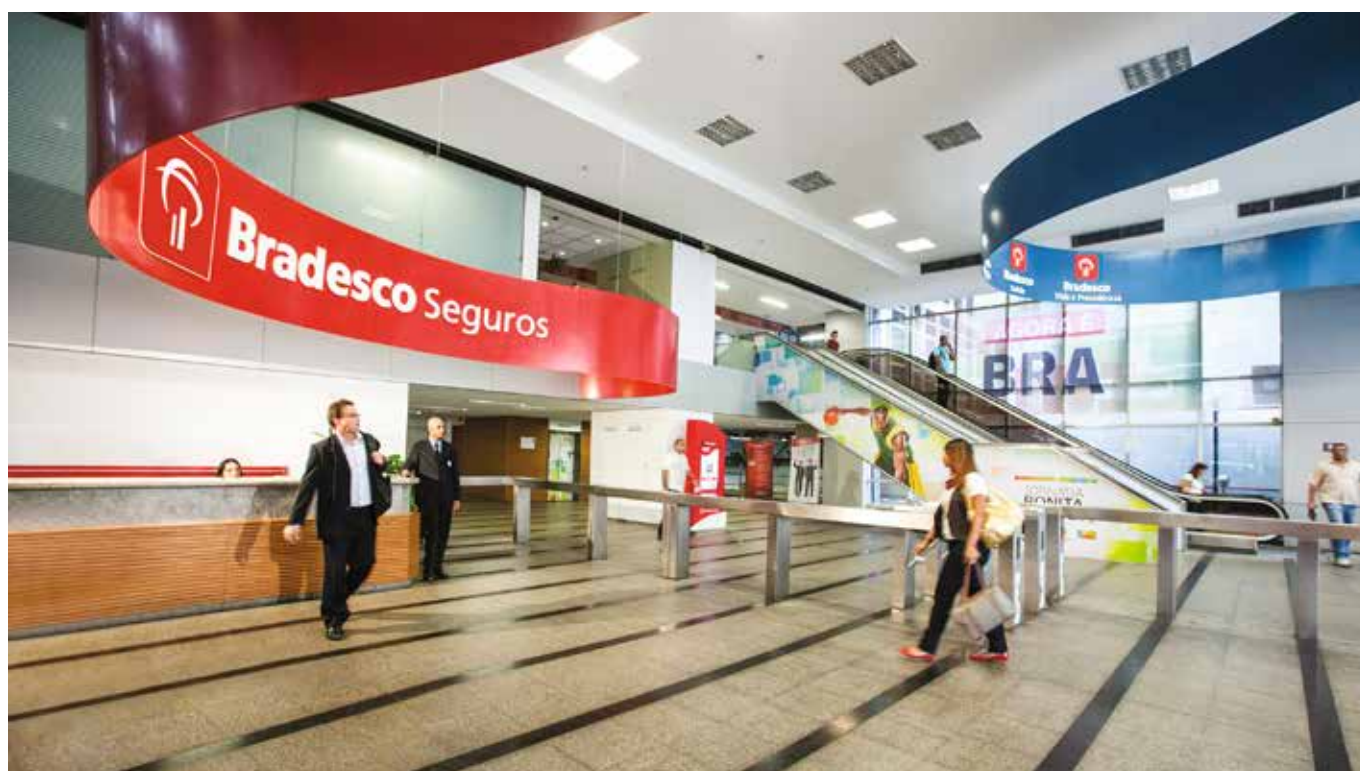
Grupo Segurador: responsável por cerca de um terço dos resultados do Banco

Os ativos totais do Banco tiveram em 2016 evolução de 19,8%, com um saldo de R$ 1,3 trilhão