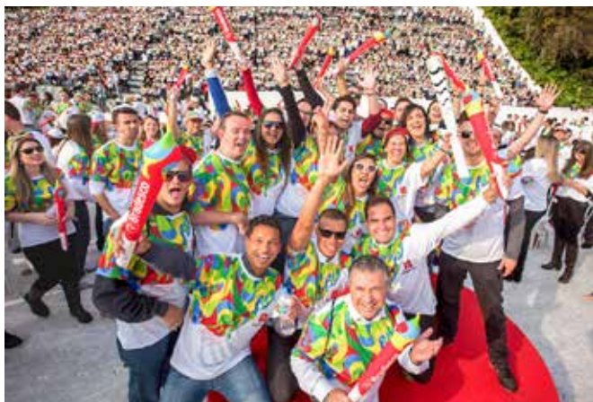
Vibração com a chegada da Tocha à Cidade de Deus

tornou-se um dos principais patrocinadores dos Jogos Olímpicos Rio 2016. Foi uma maneira de, mais uma vez, contribuir com o Brasil e o seu povo. A outra razão é o próprio esporte e tudo o que ele significa. O esporte e a educação são duas das principais contribuições que o Banco desde sempre ofereceu à sociedade brasileira.