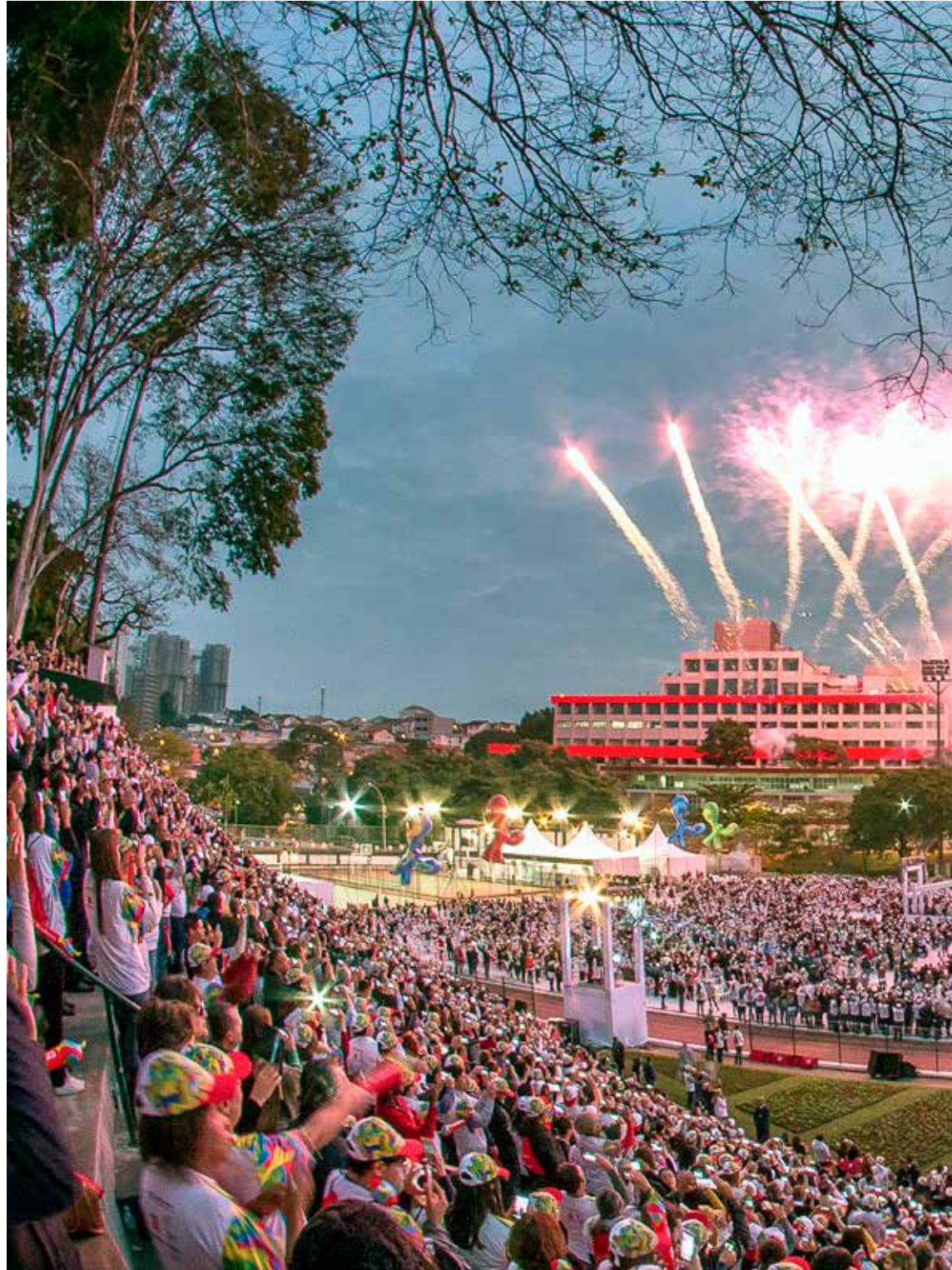
Cidade de Deus, Osasco (SP)