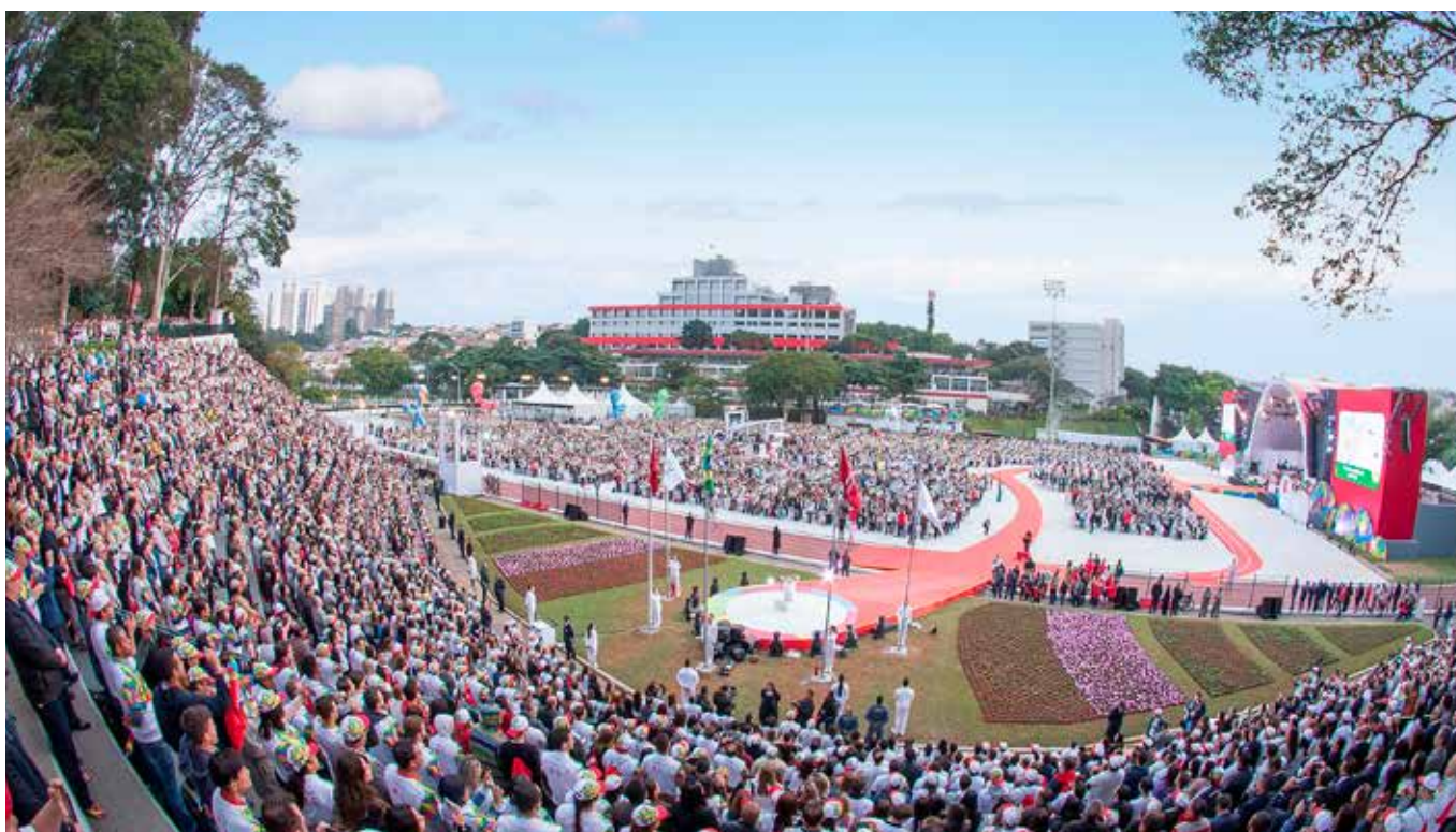
Praça de Esportes, na sede do Banco, durante cerimônia de Revezamento da Tocha

A cerimônia aconteceu na Praça de Esportes, com a participação de mais de 15 mil pessoas, entre elas o presidente do Comitê Olímpico do Brasil (COB), Carlos Arthur Nuzman, atletas das Federações Esportivas patrocinadas pelo Banco e funcionários da Organização. Na pista de atletismo, a Tocha foi conduzida por 33 pessoas, inclusive pelos Membros do Conselho de Administração