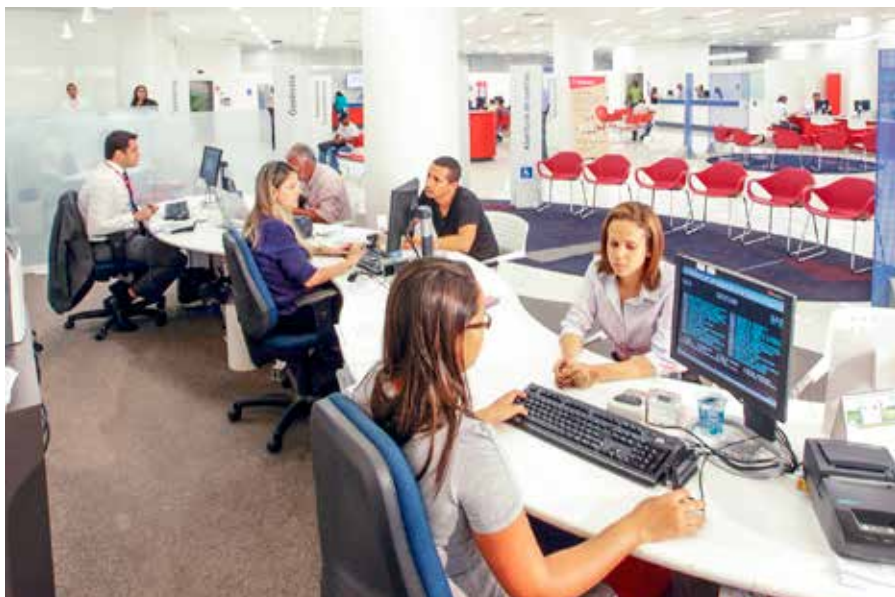
Evolução no financiamento imobiliário

O Bradesco registrou no primeiro semestre de 2016 lucro líquido ajustado de R$ 8,3 bilhões. Os ativos totais, em junho de 2016, tiveram saldo de R$ 1,1 trilhão, com um avanço de 7,3% sobre o primeiro semestre de 2015. Os recursos captados e administrados somaram R$ 1,6 trilhão no semestre, evoluindo 10,1% em relação a igual período de 2015. O patrimônio líquido teve alta de 10,8%, situando-se em R$ 96,4 bilhões. O Índice de Eficiência Operacional, de 37,4%, teve melhora de 0,5 ponto percentual sobre junho de 2015. Aos acionistas, a título de Juros sobre o Capital Próprio, foram pagos e provisionados R$ 2,9 bilhões.