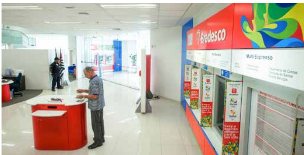
Bradesco passa a ter uma Rede de 9.343 Agências e Postos de Atendimento

Com a aprovação do Conselho Administrativo de Defesa Econômica (Cade), em junho, o Bradesco finalizou a aquisição do HSBC Brasil, anunciada em agosto do ano passado. Desde então, iniciou o processo de integração de todas as áreas de negócios do Banco, de seus ativos e de seus clientes. O processo acontece de forma gradual e deve ser finalizado entre outubro e novembro deste ano. Até lá, os clientes do HSBC serão atendidos normalmente em suas Agências e poderão contar também com produtos e serviços do Bradesco assim que a integração tecnológica entre os dois bancos estiver concluída.