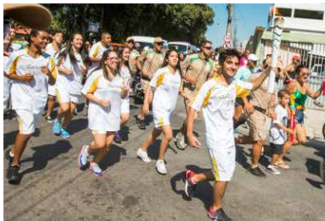
A Escola da Fundação de Vila Velha (ES) foi a primeira a ter seus alunos no Revezamento