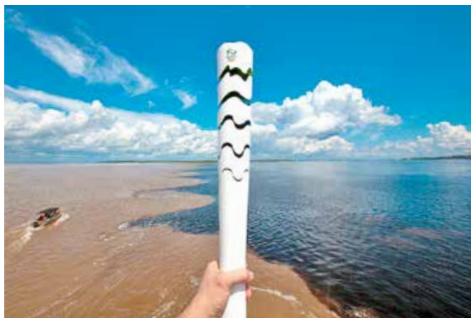
A Tocha Olímpica foi até o encontro dos rios Negro e Solimões a bordo da Agência flutuante

No ano de seu 60º aniversário, a Fundação Bradesco foi ativa no Revezamento da Tocha.