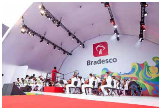
O Coral e a Orquestra da Fundação Bradesco também participaram da celebração